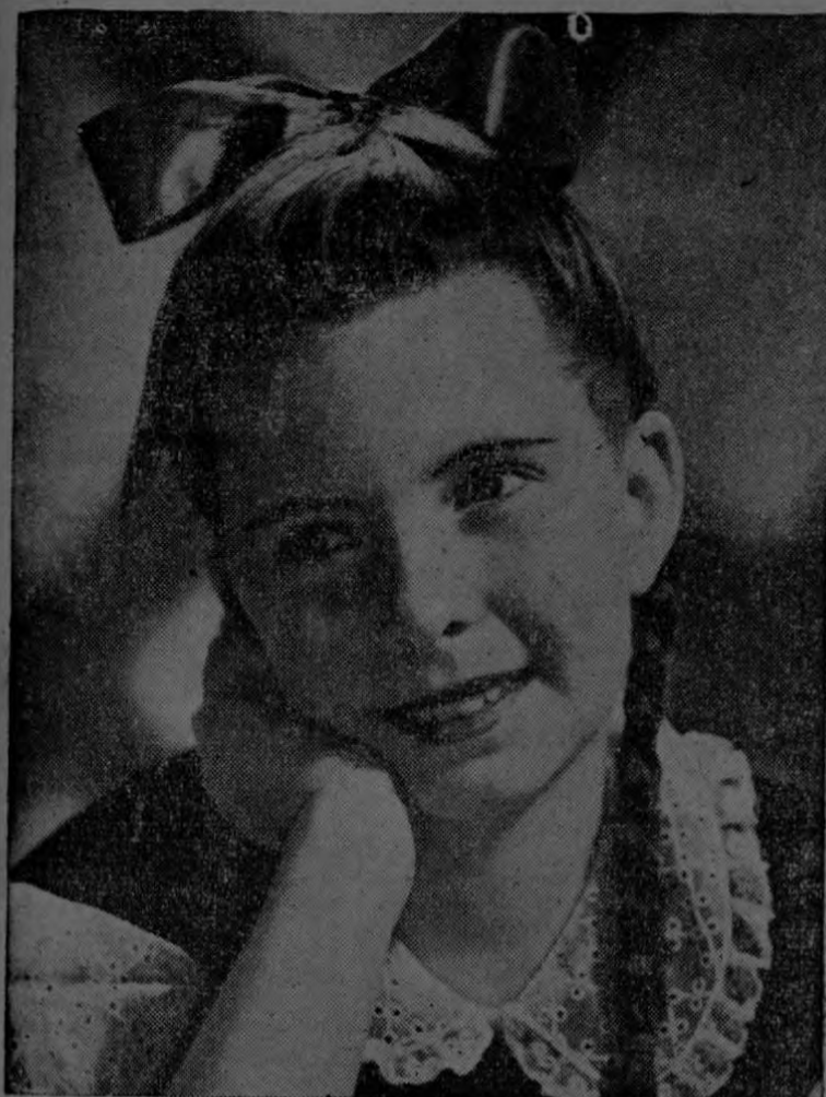
Margaret O'Brien, estrella de la Metro-Goldwyn-Mayer

Una de las más agraciadas e inteligentes actrices juveniles que jamás hayan brillado en el horizonte hollywoodense, según ha evidenciado en sus trascendentales roles en películas tales como "LA DANZA INCONCLUSA", "LA CALLE DE LOS SUEÑOS" y "LA HIJA DE TODOS", lós más recientes de sus films, Margaret O'Brien no tiene ninguna de las características que distinguen a las criaturas precoces. Cuando no está actuando frente a las cámaras, es una niña normal a quien le encanta saltar la cuerda, jugar a los "jackies", pintar monigotes, leer libros de cuentos infantiles, ves-